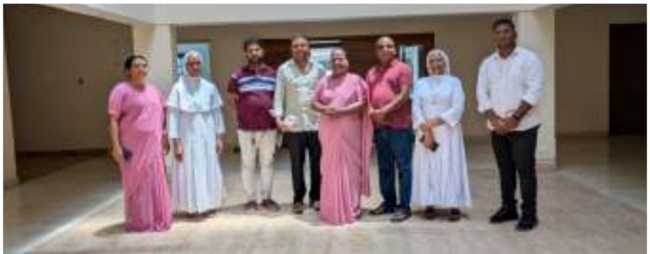
Mill Hill Missionaries Fathers Visited our Superior General, at the Generalate - 13.04.2026